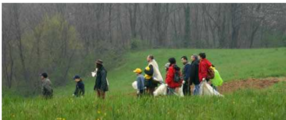
Immagine di repertorio dell'edizione precedente

da via Greppi si va verso villa Facchi e si prosegue fino in località Giovenigo. Da lì fino a cascina Rosario e poi a cascina Crotta, con la possibilità di giungere a Villa Mariani sia attraverso il bosco, sia tramite la strada.